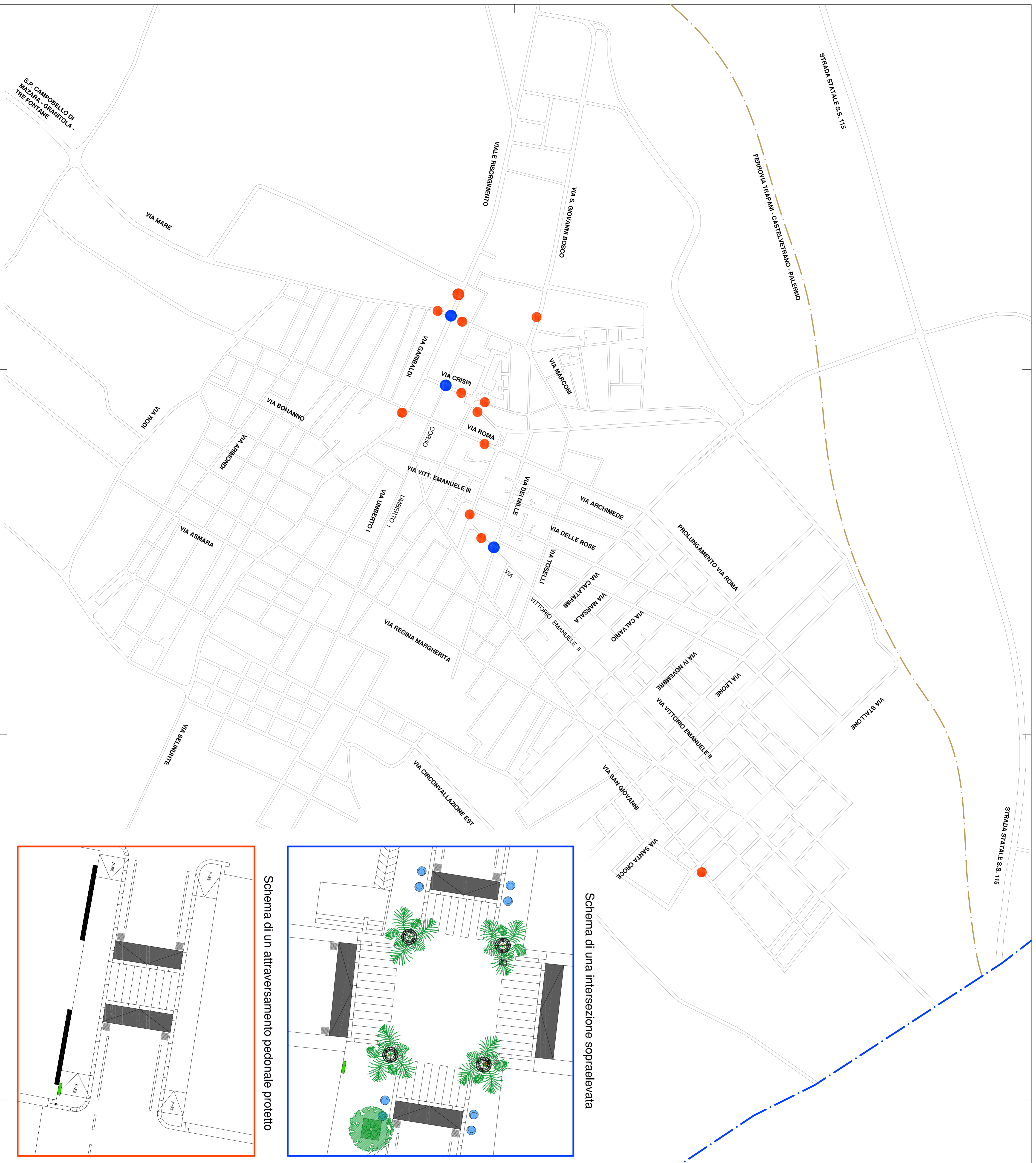
Schema di una intersezione sopraelevata